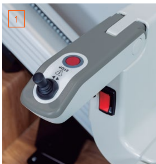
1 Bouton d'arrêt

En outre, le fauteuil peut inclure une serrure à clé pour éviter toute utilisation non autorisée et un bouton d'alarme programmable avec trois numéros afin que vous sachiez que l'aide est toujours à portée de main en cas de besoin. Vous pouvez également répondre aux appels téléphoniques grâce à cette fonction lorsque le monte-escalier est en mouvement.