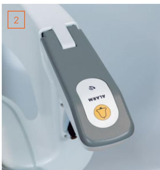
2 Bouton d'alarme